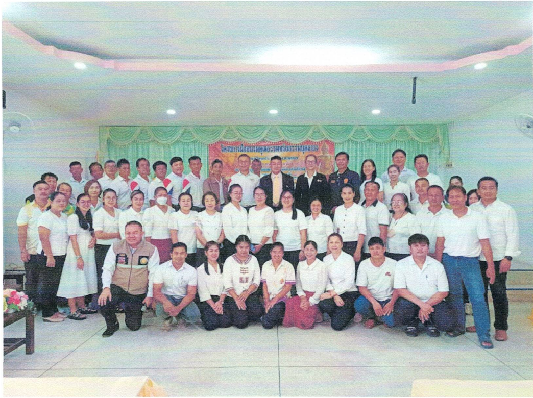
รูปภาพโครงการฝึกอบรมคุณธรรมจริยธรรมบุคลากร ประจำปีงบประมาณ พ.ศ.๒๕๖๗