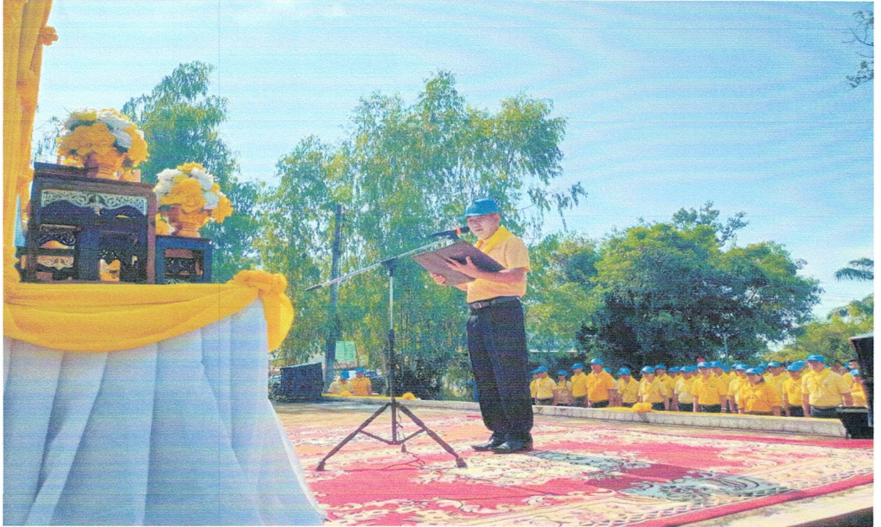
รูปภาพโครงการจัดกิจกรรมจิตอาสา “เราทำความ ดี ด้วยหัวใจ” ประจำปีงบประมาณ ๒๕๖๗ (ครั้งที่ ๒)