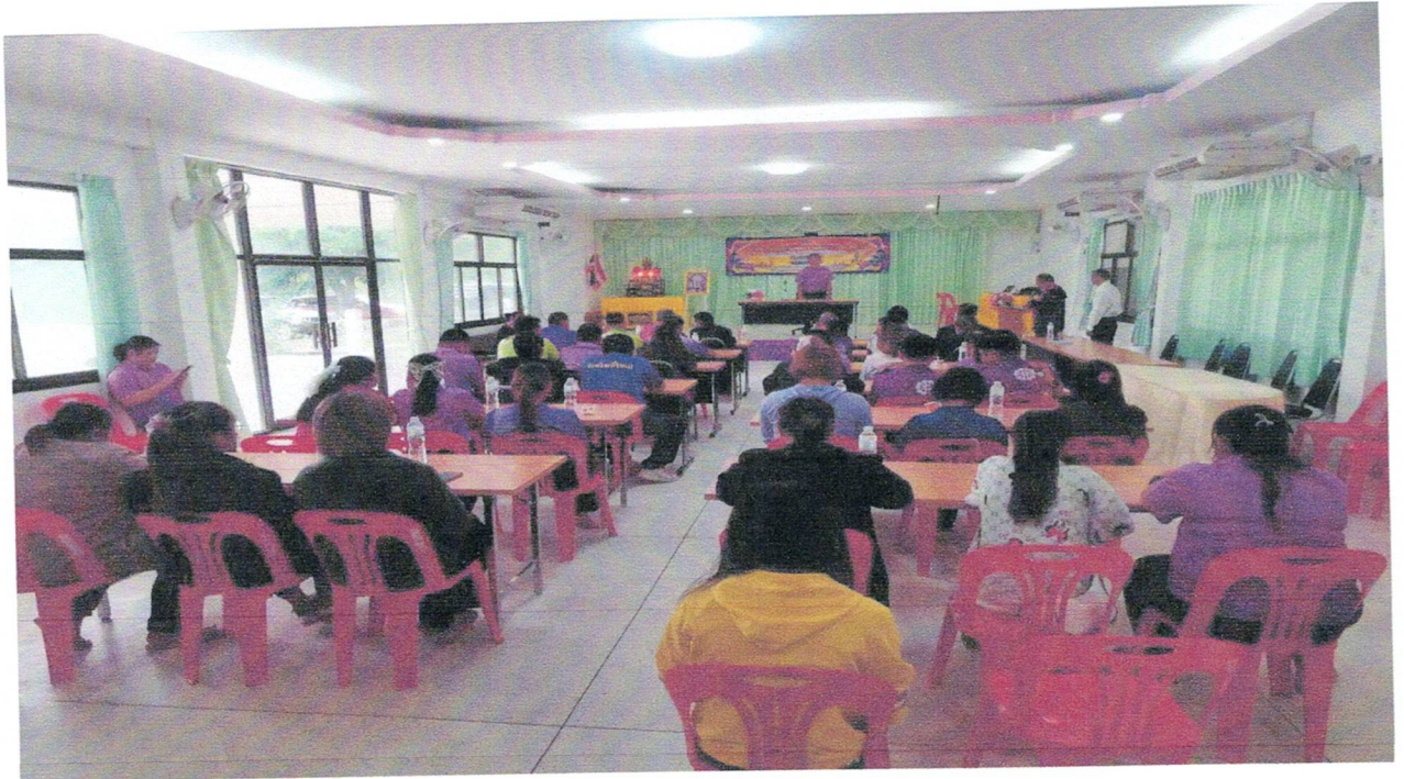
รูปภาพโครงการฝึกอบรมคุณธรรมจริยธรรมบุคลากร ประจำปีงบประมาณ พ.ศ.๒๕๖๘