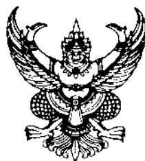
ครุฑ ขนาด ๓ เซนติเมตร