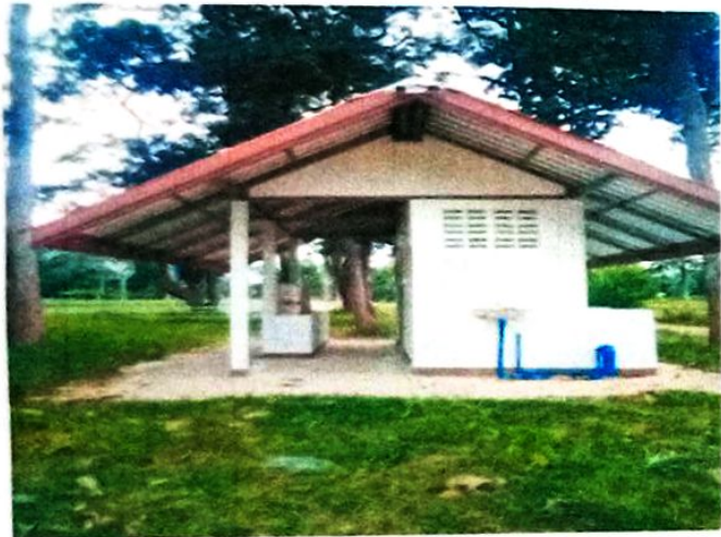
เป็นสถานที่พักผ่อนหย่อนใจและออกกำลังกาย สำหรับประชาชนทั่วไป